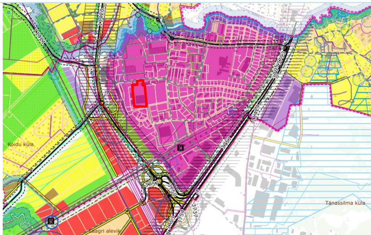
Väljavõte Saue valla kehtivast üldplaneeringust

Saue valla kehtiva üldplaneeringu (kehtestatud Saue Vallavolikogu 28.06.2021 otsusega nr 40) kohaselt paikneb planeeringuala tiheasustusalal, mille maakasutuse juhtotstarve on keskusemaa, kus võivad tihendatult asuda korterelamud, äri- ja avalikud hooned ning muud keskusesse sobivad hooned, samuti avalikud haljasalad ja pargid ning keskust teenindavad ja keskkonda sobituvad rajatised (tänavad, jalgratta- ja jalgteed, parklad, mänguväljakud jms). Keskuse maa koormusindeks peab üldjuhul olema vähemalt 200. Piirdeaedade rajamine üldjuhul ei ole lubatud.